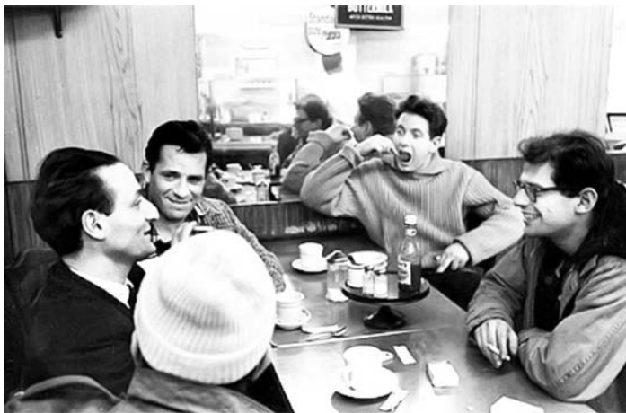
Escritores y artistas Beatlesayunando en New York a finales de 1950.

Ginsberg leyó incansablemente la obra de Pound y en particular Los Cantos que según él se sostienen a través del ritmo, del contrapunto logrado cuando cada frase enfrenta su propio eco. La reconstrucción sobre la página de lo que él denomina los sonidos de la mente, los compases naturales de la lengua, señalan la importancia otorgada al ritmo en tanto elemento constitutivo del poema. Noción que proviene de Pound quien en su Treatise on Metrics compara con las formas, como pueden ser la quilla de un barco o el motor de un automóvil, antes de declarar enfáticamente: El ritmo es una forma del tiempo. Pero, quizás la influencia más grande que podemos percibir en el autor de La Calle de América o Wichita o Vortex es la de su maestro William Carlos Williams, cuya escritura rescata la vivacidad y espontaneidad del lenguaje coloquial norteamericano.